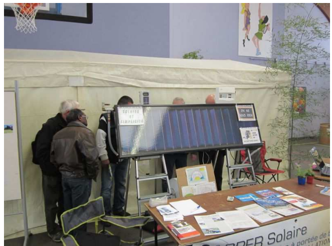
... de plus en plus curieux sur le système "drainback" !