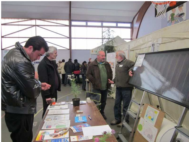
Les premiers "clients" ...