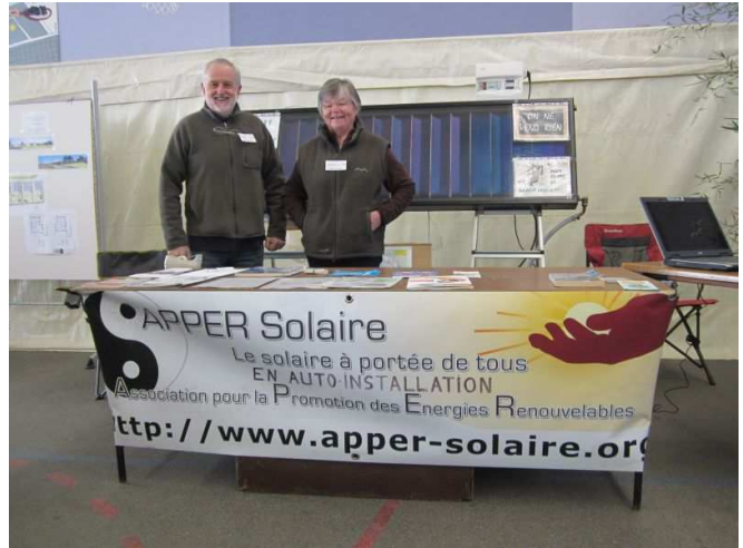
L'équipe de choc (les 2 font l'APPER)