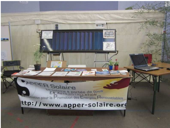
Le stand prêt à 10h00