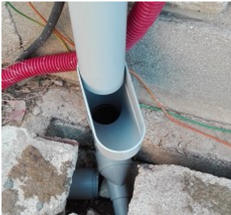
Figure 1 : point pour alimenter la cuve

La photo suivante est un point de collecte disponible pour verser les eaux utiles à destinations de la cuve. Et sert régulièrement pour vider le trop plein des 4 cuves d'eau de pluie destiné à l'arrosage ( ou lors de l'hivernage )