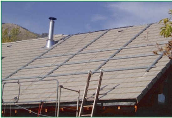
Construction d'un chassis