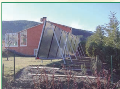
Une installation de chauffage solaire en rez-de-jardin à St-André-les-Alpes