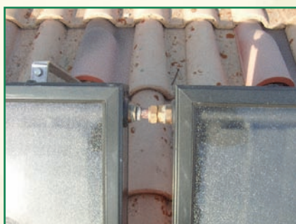
Raccordement des panneaux entre eux à La Mure

plancher chauffant ou radiateurs surdimensionnés correctement). Sous nos climats de montagne, il est obligatoire de fonctionner en bi-énergie avec un système complémentaire comme un poêle à bois ou à granules par exemple.