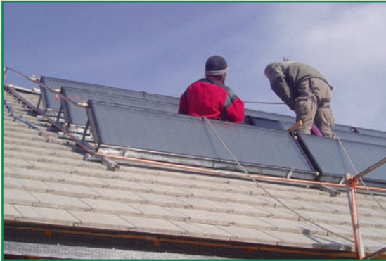
Pose des panneaux